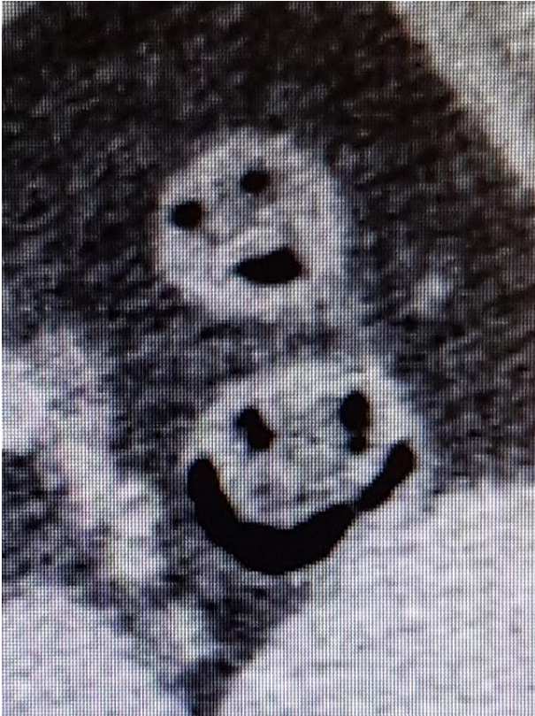
Figura 2: Hallazgos en las imágenes que despiertan parecidos