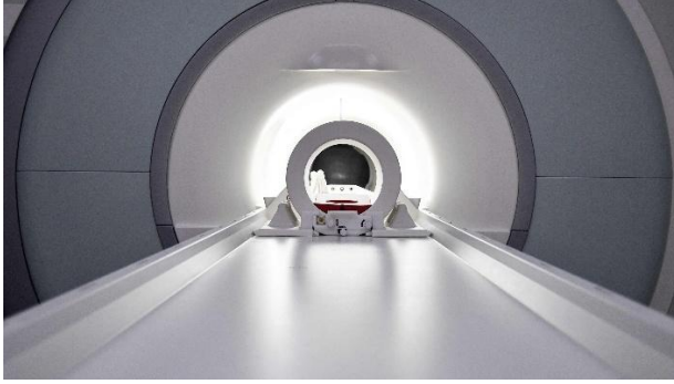
Figura 4: Expresión Libre